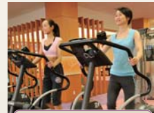
カーディオバイク

初心者が筋肉をつけるためのウエイトトレーニング、本気で筋肉を鍛えたい方など、様々な用途で使えます。