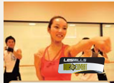
ボディコンパット

ズンバはラテン系を中心とした世界の「音楽」と「ダンス」、それにフィットネスエクササイズを融合させたダンスエクササイズ。